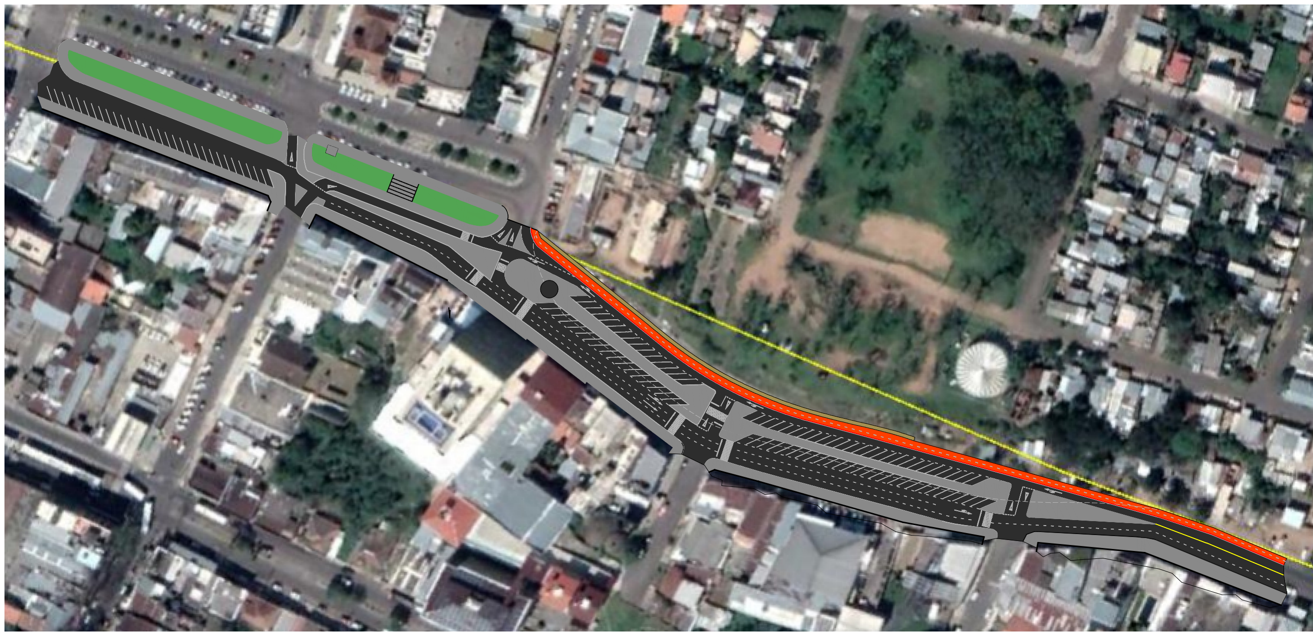
IMPLANTAÇÃO Esc.: 1:1.500

A proposta visa valorizar e organizar a linha de fronteira entre Brasil e Uruguai, exatamente na Avenida João Pessoa, no trecho entre a Rua dos Andradas e Rua Senador Salgado Filho (Área de 17.866,32m²). O projeto parte da definição de um uso para a área de estacionamento localizada em frente ao Cerro do Marco que hoje encontra-se sub utilizada e avança na organização do trânsito em direção a Rua dos Andradas. O estacionamento recebe na sua face Sul a continuação da ciclofaixa e uma via de trânsito, no seu centro um estacionamento obliquo que poderá ser utilizado por veículos de passeio e utilitários durante a semana e por ônibus de turismo durante os finais de semana, tendo os seus meio fios rebalzados para proporcionar tal uso. Na extremidade Leste existe espaço destinado a quiosque e bicicletário. Dentro da proposta de transformar a área em um espaço multiuso propomos que os estacionamentos, a via localizada ao Sul e a ciclovia sejam fechadas aos domingos e feriados para transformar-se em uma grande área de lazer e espaço para eventos, permanecendo as vias ao Norte abertas para a trânsito de veículos, invertendo-se o sentido de uma das vias. Seguindo em direção a Rua dos Andradas foram propostas algumas ilhas e intervenções no trânsito visando a sua organização e melhor fluidez, buscando uma integração com as praças da linha de fronteira e futuramente com o Largo Hugolino e Rua dos Andradas para onde existem estudos preliminares de intervenção.